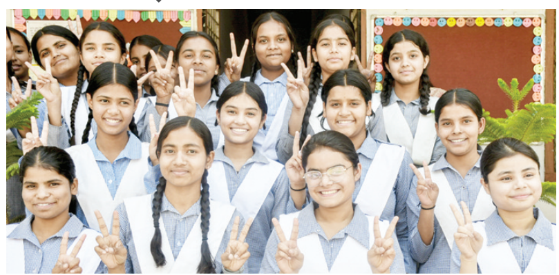
उत्तराखंड बोर्ड परीक्षा परिणाम में लड़कियों ने लड़कों से बेहतर प्रदर्शन किया।